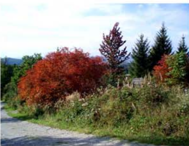
11. Aboretum Bad Grund