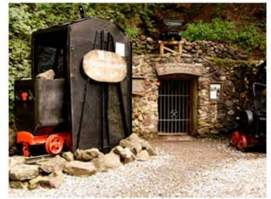
6. Scholmzeche Bad Lauterberg