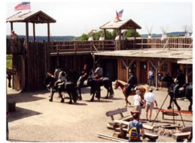
3. Westernstadt Pullman-City Harz