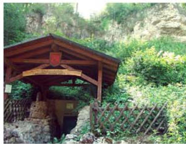
7. Einhornhöhle Scharzfeld