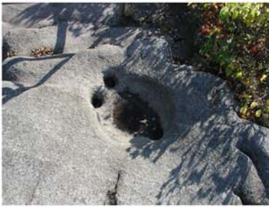
1. Rosstrappe Thale