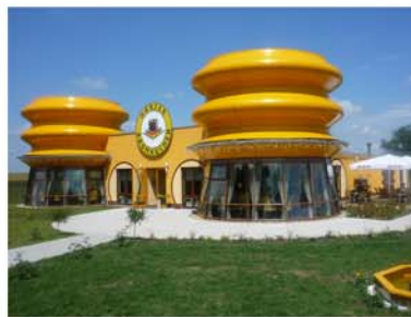
14. Baumkuchenhaus Nr.1 Wernigerode