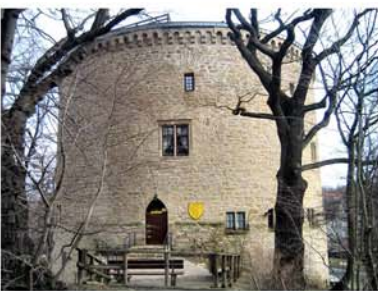
13. Zwinger in Goslar