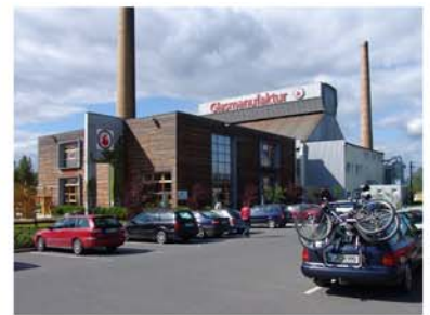
15. Glasmanufaktur Derenburg