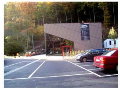
10. Höhlenerlebniszentrum Bad Grund