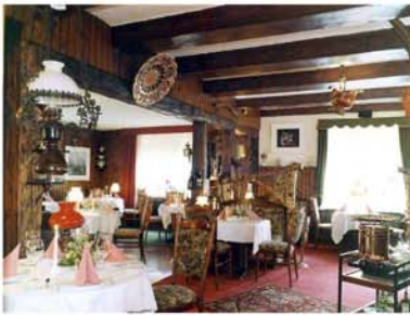
4. Hohegeiß "Landhaus bei Wolfgang"