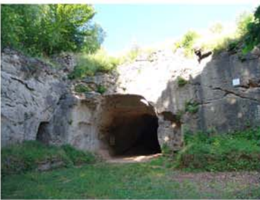
7. Steinkirche Scharzfeld