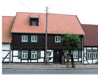
2. Mausefallenmuseum Güntersberge