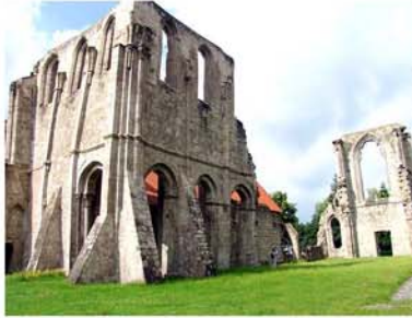
5. Reichsstift Walkenried