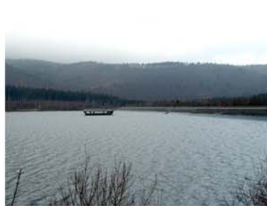
12. Innerste Talsperre Lautenthal